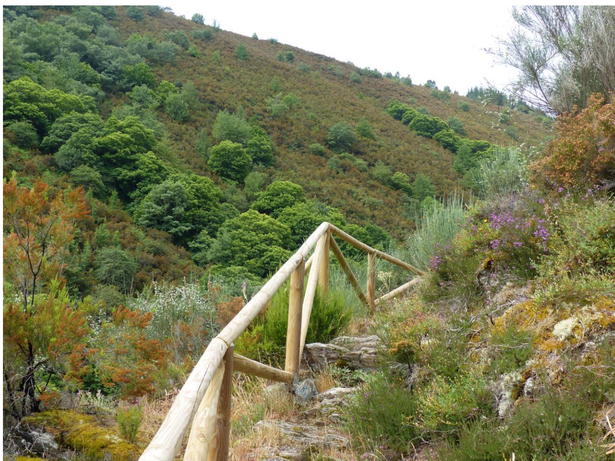
Tramo de la ruta Quintá-Río Donsal