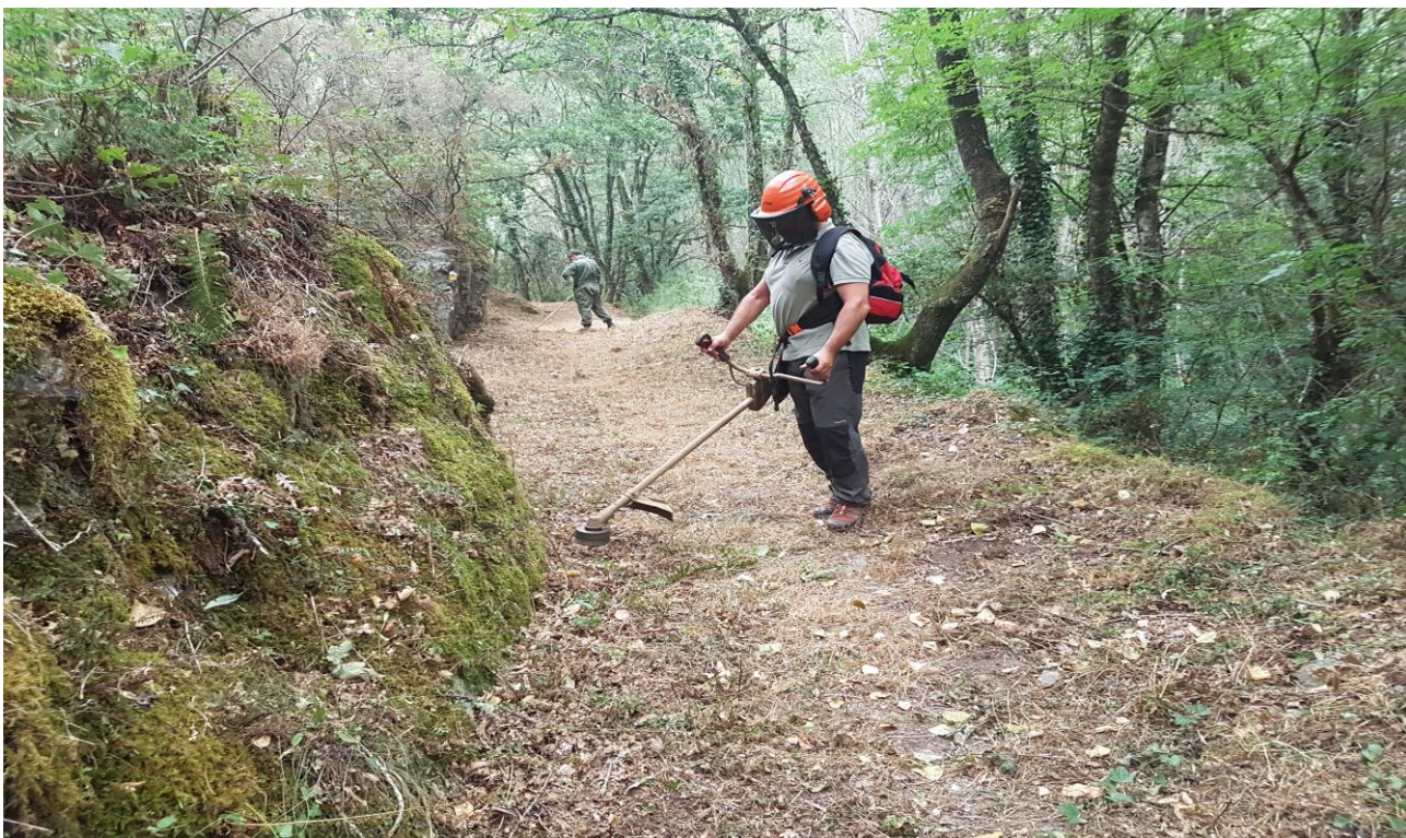
General Jefe de la FLO y un colaborador cooperando en los trabajos del CTI 2017