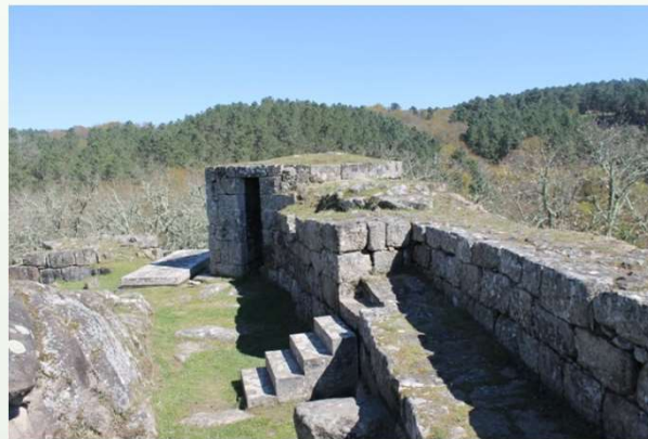
Muralla exterior y torre con saetera